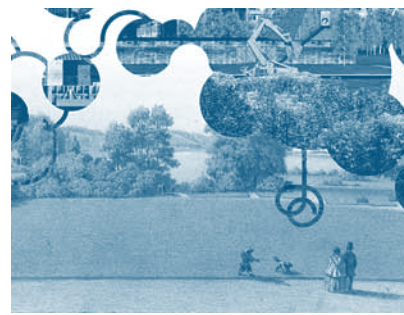
Aedade järelle 10.05.–08.09.2013