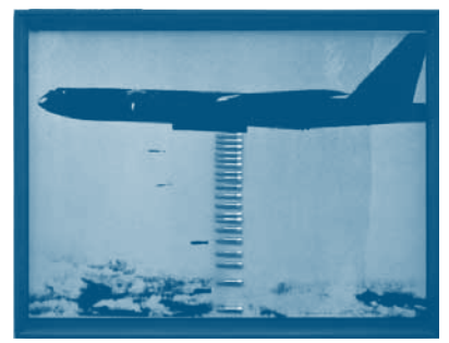
Kriitika ja kriisid. Kunst Euroopas alates 1945 28.06.–03.11.2013